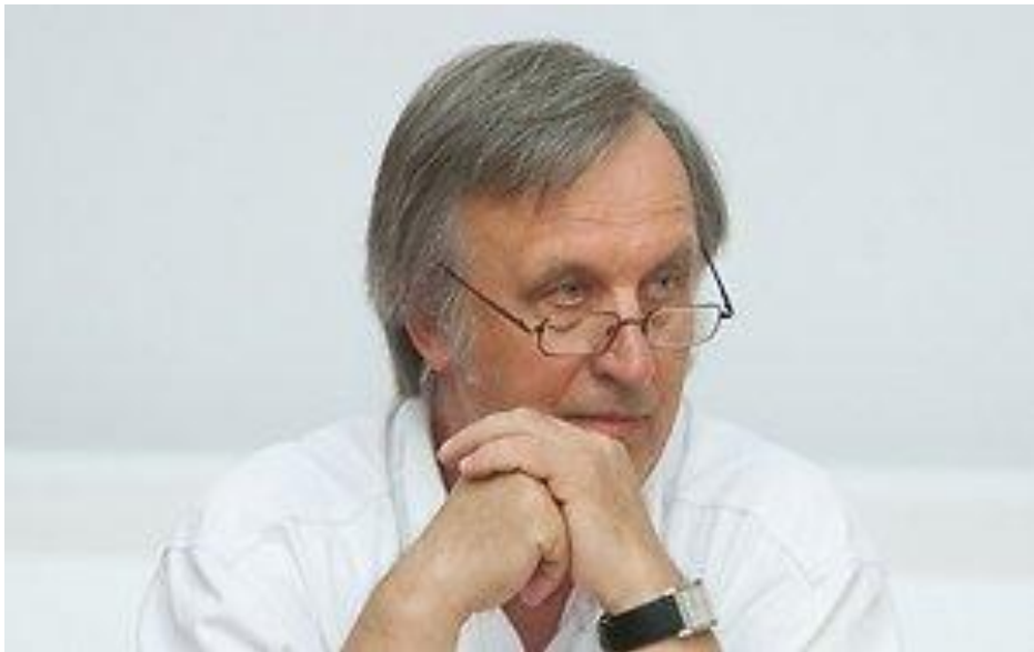
Prof. Povilas Gylys

„Drąsos kelias“ politinė partija kviečia į susitikimą-diskusiją su LR Seimo nariais: prof. P. Gyliu ir J. Varkala.